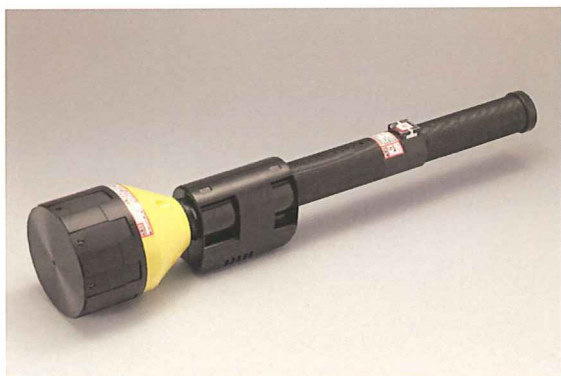
ネットランチャーAL Type II