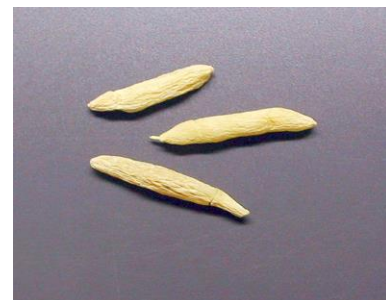
生薬: 麦門冬 ジャノヒゲの貯蔵根