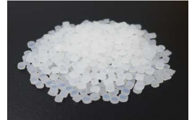
Fig. 1 モディパー® AS155 の外観