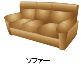
Fig. 4 モディパー® AS155 の用途