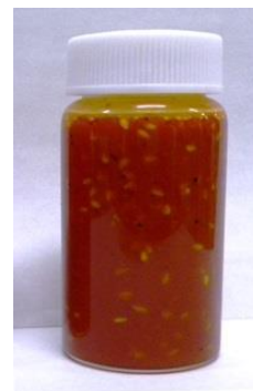
固形分が均一に分散