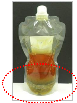
固形分が沈降し、均一になりません