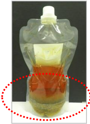
固形分が沈降し、均一になりません