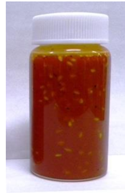
固形分が均一に分散

「ディナーオイル ® 」は冷蔵～室温まで、粘度がほぼ一定です。「低温でも固まらない」、「室温でも粘度がある」特長を生かして様々な用途で応用いただけます。