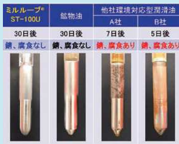
防錆性能比較試験結果 (60°Cの潤滑油:天然海水(95:5)液中に一定時間浸漬し、腐食状況を比較)

2010年にメキシコ湾で発生した原油大量流出事故をきっかけに、米国で2013年に船舶に対して2013VGP規制が施行されました。この規制をきっかけに世界的に生分解性環境対応型潤滑油のニーズが高まりました。この市場に対応すべく開発した船尾管軸受油「ミルルーブ®ST-100U」は、従来の他社生分解性潤滑油に不足していた潤滑性能や防錆性能を大きく改善すると同時に、高生分解性、低毒性、低生物蓄積性で2013VGP規制を満足し、非常に優れた潤滑油として、海洋保全に貢献しています。