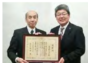
2022年度の感謝状贈呈式

日油は、CSR活動の一環として、「緑の募金」の事業体である公益社団法人国土緑化推進機構への寄付による支援を行っています。同機構は、植林等による自然環境保護の分野において、わが国の中心的役割を担っていて、日油は、その事業計画に賛同し、2015年度以降継続的に支援を行っています。