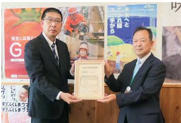
県南農林事務所長と製造所長の記念写真