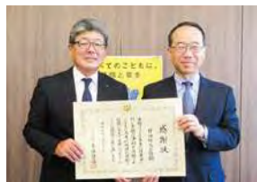
2023年度の感謝状贈呈式

日油は、CSR活動の一環として、内閣府の「こどもの未来応援基金」への寄付による支援を継続的に