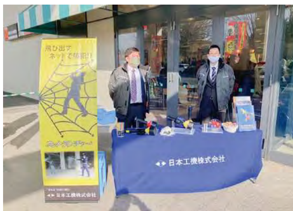
白河警察署「110番の日」防犯製品展示デモ (日本工機)

日本工機(株)では地元・白河警察署「110番の日」イベントに協力し、防犯製品の展示およびネットランチャーのデモを実施しました。