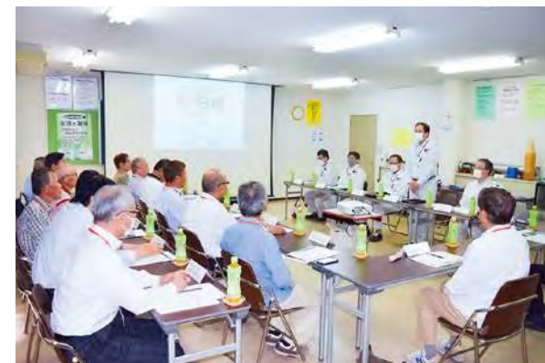
近隣区長の事業所見学会 (愛知事業所)