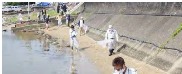
富貴港清掃活動(愛知事業所)