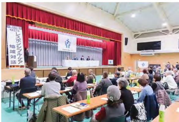
大分地区RC地域対話 (大分工場)

新型コロナウイルス感染防止の観点から、ここ数年中止となっていた地域対話、工場見学会などを再開し、これまで以上に地域・社会の皆さまとの交流や対話を実施していきます。