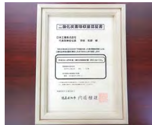
福島県より頂いた二酸化炭素吸収森林の認証書