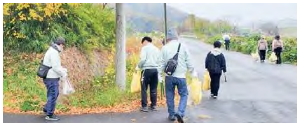
地域清掃活動参加(昭和金属工業㈱)