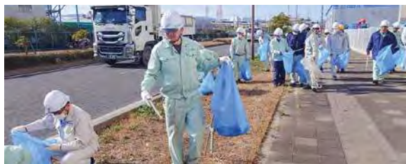
尼宝線清掃活動(ニチユ物流㈱)

日油グループは、工場所在地の近隣地域の清掃ボランティア活動に積極的に取り組んでいます。地域の美化や環境保護に対する責任感を持ち、社員が一人ひとりがごみ拾いや清掃活動に参加しています。