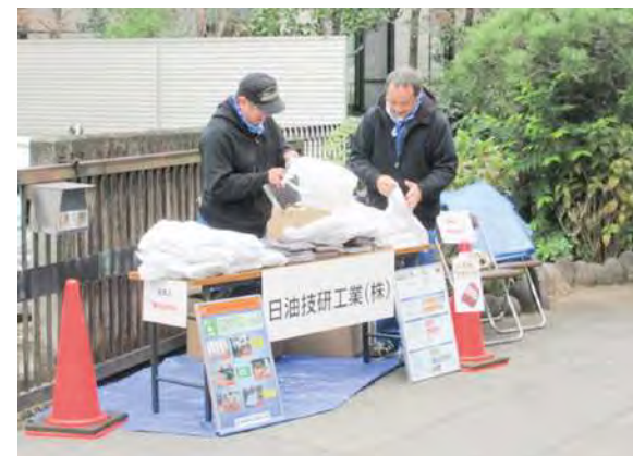
地域ふれあい福祉まつり (日油技研工業株)

日油技研工業(株)は、より良い地域づくりに向けた話し合いを行う場として実施される川越市の地域会議イベントの「福祉の市」で工場内の腐葉土を提供しました。