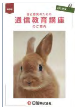
冊子 「通信教育講座のご案内」