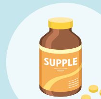
プロテイン/サプリメント