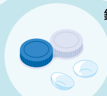
コンタクトレンズ