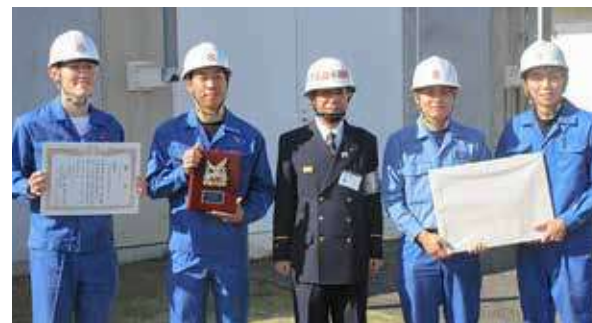
自衛消防隊消火操法競技大会表彰（日油技研工業㈱）