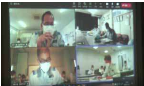
全社合同訓練（オンライン：川崎事業所、愛知事業所、尼崎工場、大分工場）