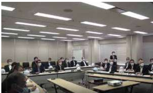
全社合同訓練（本社）

また、感染症の流行やサイバー攻撃などの非常事態に備えたBCPの整備や教育に関しても、継続的な取り組みを行い、積極的にBCPの拡充を図っています。