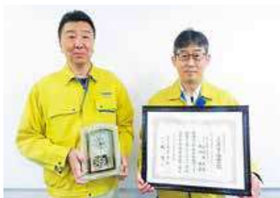
火薬学会技術賞受賞(日本工機(株))