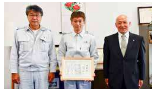
美唄市危険物安全管理協会表彰(北海道日油(株))