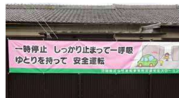
交通横断幕（愛知事業所）