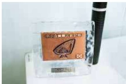
中小企業無災害記録受賞(ニチユ物流(株)大分)