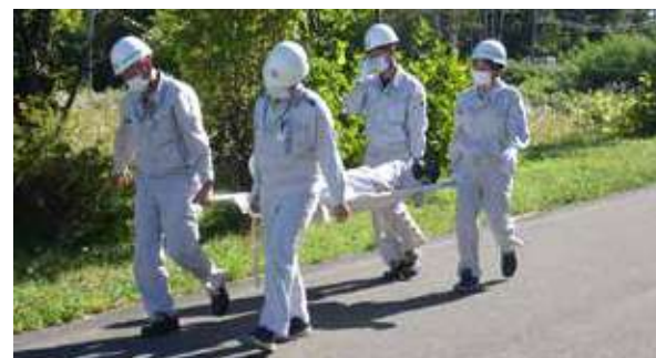
負傷者搬送訓練（北海道日油㈱）