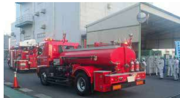
千鳥地区防災協との合同総合防災訓練（川崎事業所）