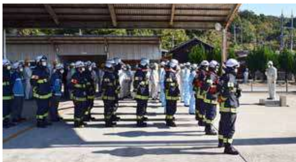
武豊町・近隣消防署との合同防災訓練（愛知事業所）

また、地元自衛消防隊消火操法大会などにも積極的に参加することで、消火技術の向上と地域へ安全意識の高さをアピールしています。