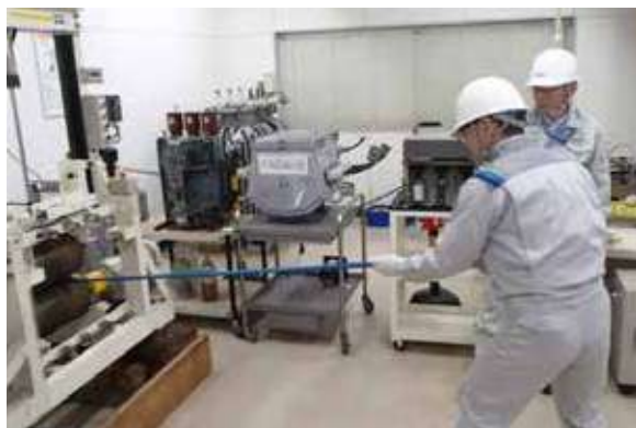
回転体巻き込まれ体験(尼崎工場)

日油グループは、労働災害防止のための教育手段として、疑似的に危険性を体験として学ぶ体験・体感型安全教育を導入し、従業員の危険に対する感受性や安全意識の向上を図っています。