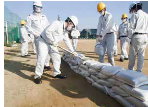
流出対策訓練 (尼崎工場)