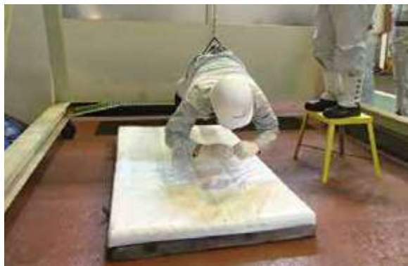
高所墜落体験(尼崎工場)

外部教育を主に行ってきましたが、社内にも体感教育を導入し、より現場に即した教育にも取り組んでいます。