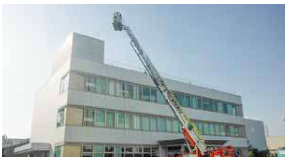
高所救護訓練（尼崎工場）