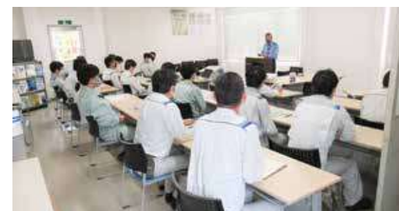
大分東警察署による交通安全教育（大分工場）

2022年度に多発した通勤災害や業務上の交通事故の低減を目指し、交通安全への取り組み強化を実施しました。交通安全は事業所、関係会社の実情に合わせた独自の活動を進めています。活動内容としては、「交通安全週間パンフレット配布」「警察署による安全講話」「交通スローガン横断幕掲揚」などを実施しました。