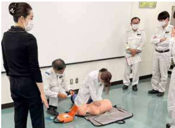
救命救急訓練 (先端技術研究所)

日油グループの全従業員がRCに関して理解を深めるために教育に力を入れています。2022年度は、のべ53,066人が参加し、のべ時間約4.1万時間のRC関連の教育訓練を実施しました。