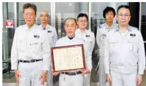
神奈川県工業保安功労者表彰(川崎事業所)