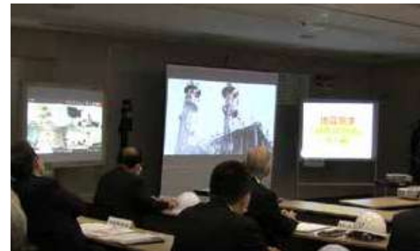
全社合同訓練（本社非常事態対策本部）