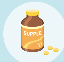
プロテイン/ サプリメント