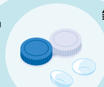
コンタクトレンズ