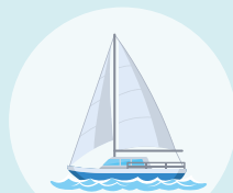
船舶(ヨット・ボート)