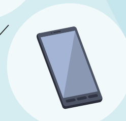
タブレット/スマートフォン