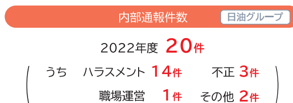
内部通報5年間推移

2022年度は、ハラスメントを主に20件とこれまでに比して、大きく増加しました。これは、2022年6月の公益通報者保護法の改正を受け、社内規定の改定とともに、法改正の趣旨説明（通報者探索、不利益取り扱いの禁止等）、通報窓口の周知を丁寧に行った結果と推察されます。また、いずれの通報に対しても迅速かつ通報者探索のないよう、慎重に事実関係の調査を行い、必要な是正措置、再発防止策を講じました。